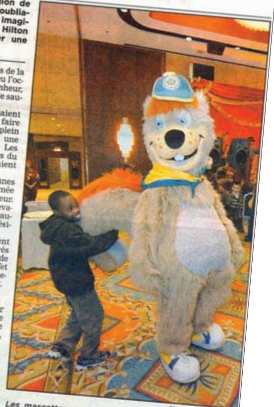
Les mascottes ont bien amusé les jeunes qui étaient tout sourire.

L'an dernier, il y a un jeune garçon qui est venu me demander s'il pouvait se servir une deuxième fois. Il mettait de la nourriture dans ses poches pour son frère. C'est là que ça fait mal au cœur. On se rend compte que, s'ils prennent la peine de demander la permission, c'est parce qu'il n'y a pas d'abondance à la maison », a partagé une employée de l'hôtel.